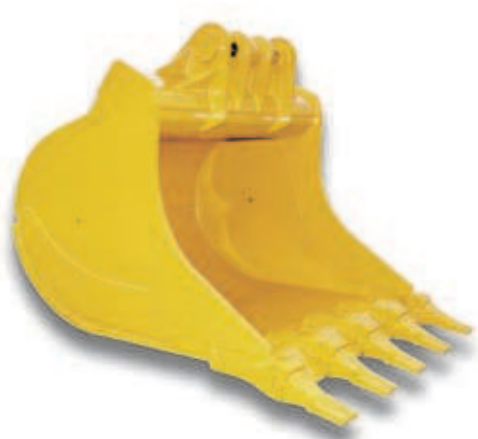
FELSTIEFLÖFFEL - Die von Belastung und Verschleiss besonders betroffenen Teile werden aus Hardox 400 gefertigt. In Verbindung mit den robusten Zähnen ist der Löffel für extrem schweren Einsatz geeignet.